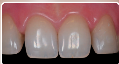
Pacjent z diastemami - sytuacja wyjściowa.