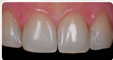
Zamknięcie diastem z zastosowaniem OliREVO, zęby 12, 11 oraz 21, 22.